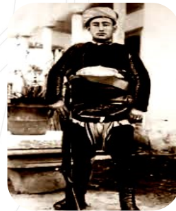
YÖRÜK ALİ EFE