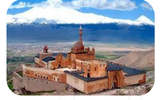
İshak Paşa Sarayı