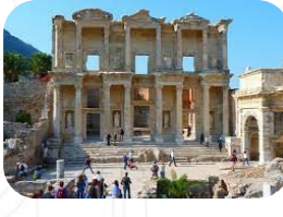
Efes Antik Kenti