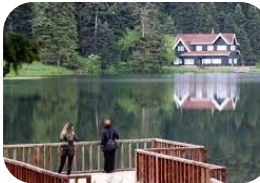
Yedigöller Milli Parkı