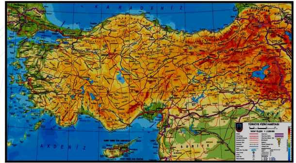
Türkiye ..... haritası