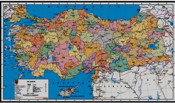
Türkiye ..... haritası

Aşağıda verilen Türkiye haritalarına bakarak ne haritası olduğunu yazalım ve bu haritalardan ulaşacağımız bilgileri noktalı yerlere yazalım.